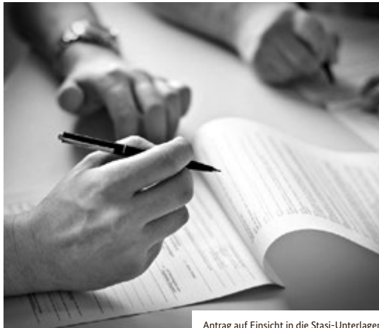
Antrag auf Einsicht in die Stasi-Unterlagen

Do | 06.06.2024 | 13:00–20:00 Grenzmuseum Schiffersgrund