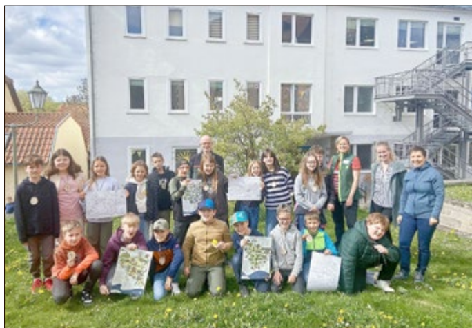
Die Viertklässler der Grundschule Berka halten die drei Kinderkarten und das Ausmalbild in ihren Händen. Vorab erlebten Sie eine bewegungs- und lehrreiche Unterrichtsstunde zum Thema Natur.

Leiterin Naturpark Eichsfeld-Hainich-Werratal