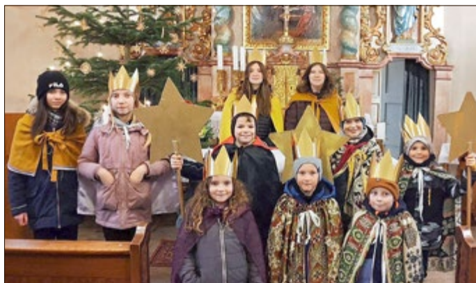
Sternsinger in Steinheuterode