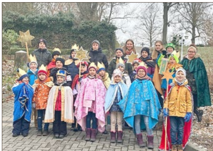
Sternsinger in Birkenfelde

leider hat sich in der Januar-Ausgabe des Höhberg Echos beim Artikel zu den Sternsinger-Aktionen bei der Bilderzuordnung der Fehlerleufel eingeschlichen. Wir bitten vielmals um Entschuldigung.