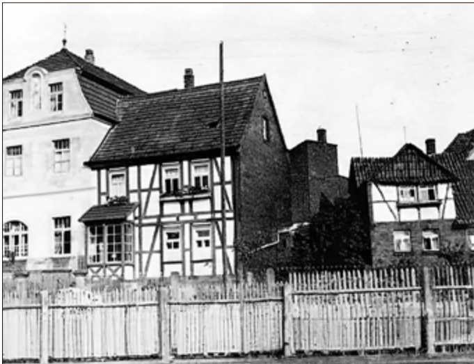
Schwesternhaus (links) mit dem 1970 abgerissenen, kleinen Nebenhaus für die Herren-Altenpflege (rechts).