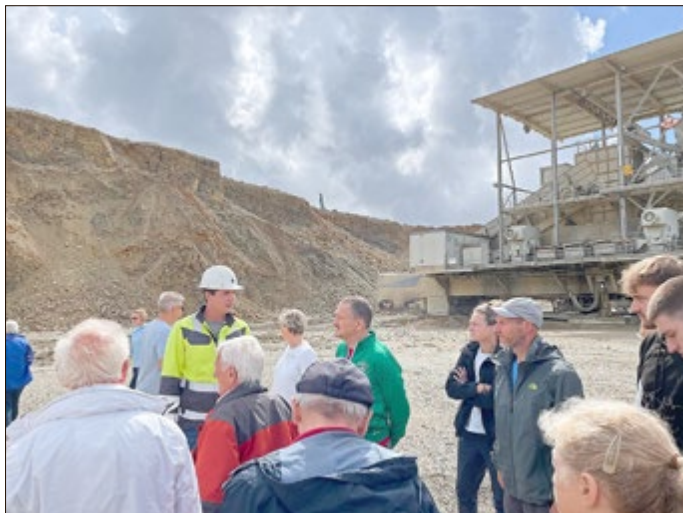
Erläuterungen zum Kalksteinabbau in Deuna

Für Rückfragen steht Uwe Müller vom Naturpark Eichsfeld-Hainich-Werratal unter Telefon: 0361 57391 5004 gern zur Verfügung.