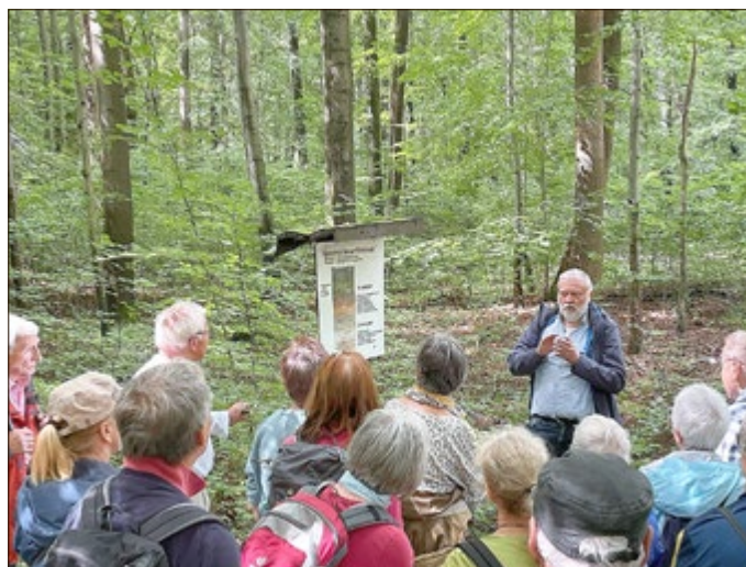
Unterwegs auf dem Naturlehrpfad im Keulaer Wald

Die Tour bot den Teilnehmern nicht nur die Möglichkeit, die faszinierende Produktionsstätte hautnah zu erleben, sondern auch interessante Einblicke in die Prozesse der modernen Zementherstellung zu erhalten. Dank der professionellen Führung wurde das Zementwerk zu einem wahren Highlight der Tour. Auch die Fahrt durch den Steinbruch mit Erläuterungen zum Kalksteinabbau traf auf großes Interesse.