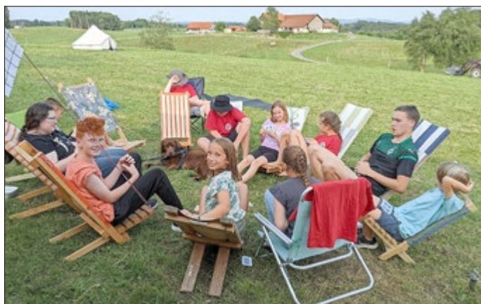
Beim Karten spielen