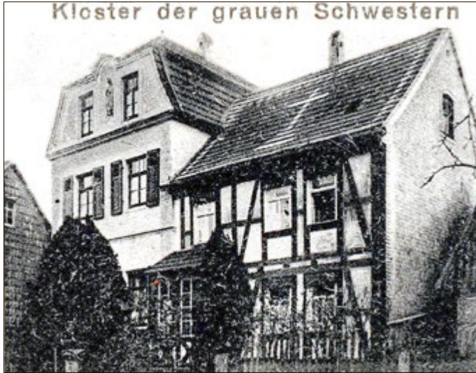
Das Schwesternhaus „St. Katharinenstift“ auf einer Postkarte von 1917. Foto: (Bernhard Siebert: Uder und seine Geschichte. 1938)