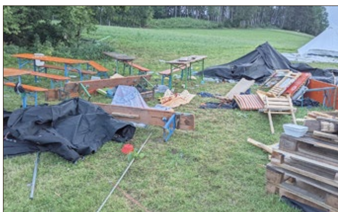
Nach dem Sturm