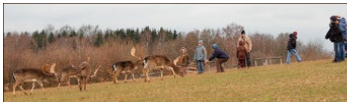
Mit etwas Glück kommt man ganz nah an das oft scheue Damwild

Wer kennt den Unterschied zwischen Hirsch und Reh? Dam- wildfütterungen im Natur-Erlebniszentrum Gut Herbigshagen