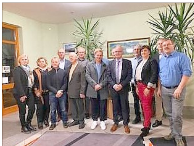
Die Bürgermeister der VG Uder