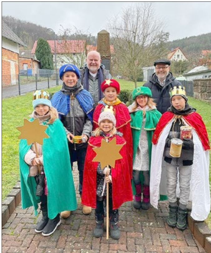
Sternsinger in Schönhagen