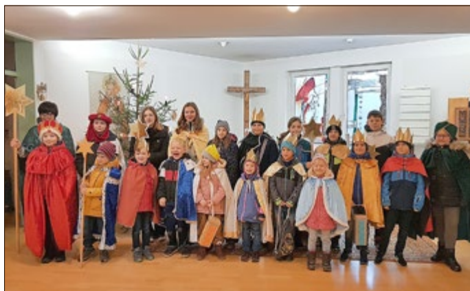
Sternsinger in Birkenfelde

Im Anschluss konnten sich die Kinder bei heißem Tee und Pizza aufwärmen und sahen auch den diesjährigen Sternsinger-Film. Gespannt warteten sie auf das Ergebnis ihrer Sammel-Aktion. Am Ende freuten sie sich sehr über den stolzen Betrag in Höhe von 2.291,00 EUR.