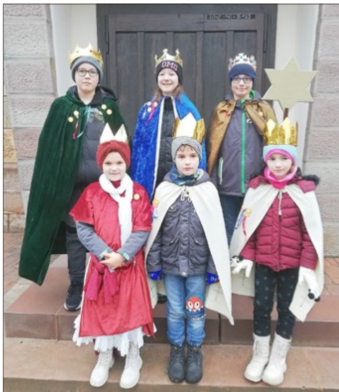
Sternsinger in Eichstruth