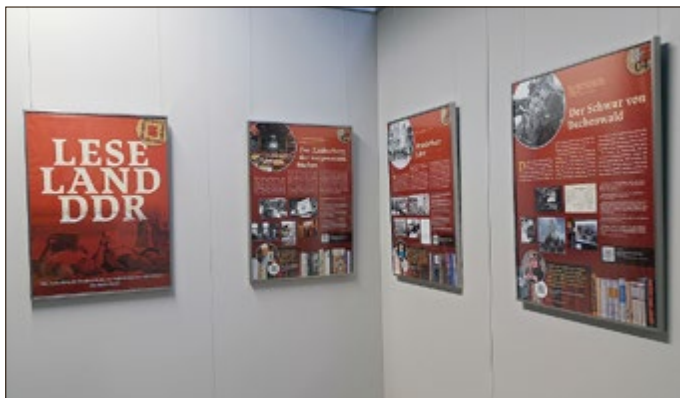
Sonderausstellung „Leseland DDR“ im Grenzmuseum Schiffersgrund

Asbach-Sickenberg. 20 Ausstellungstafeln mit Texten, Bildern und Videos laden ab sofort am Grenzmuseum Schiffersgrund zu einer anschaulichen Zeitreise durch das Leseland DDR ein. Ein Land, dessen Obrigkeit an die Macht des geschriebenen Wortes glaubte und es zugleich fürchtete. Wo das Lesen und Schreiben mit großem Aufwand gefördert wurde, während politisch unerwünschte Literatur in Bibliotheken nur mit einem Giftschein zugänglich war und Post und Reisende aus dem Westen nach Gedrucktem gefilzt wurden.