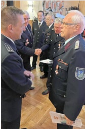
Auszeichnung für 60-jährige Mitgliedschaft bei der FFW