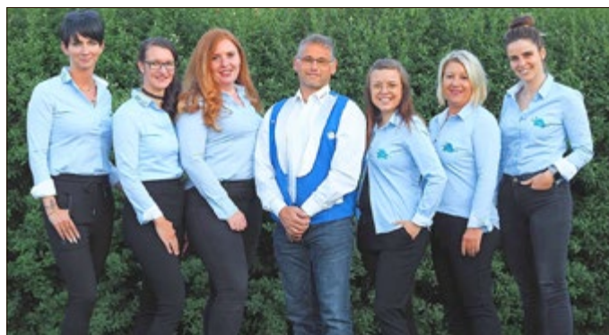
Der neue Vorstand des SCU