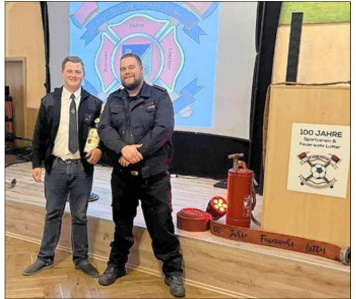
Gratulanten aus Pfaffschwende