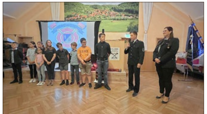
Gruppe der Jugendfeuerwehr Lutter