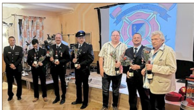
Auszeichnung für 25 Jahre Mitgliedschaft Feuerwehr