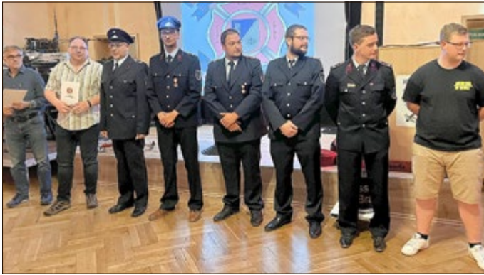
Auszeichnung mit der Ehrennadel des Thüringer FFW-Verbandes