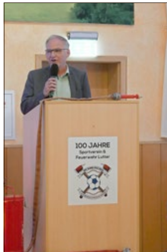
Auch der Gemeinschaftsvorsitzende gratuliert zum Jubiläum