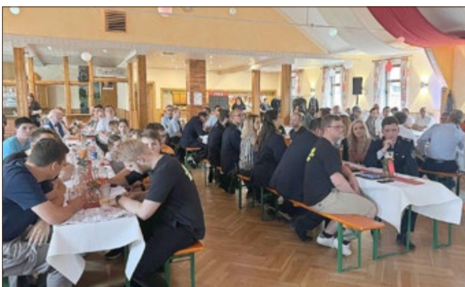
Zahlreiche Gäste sind erschienen