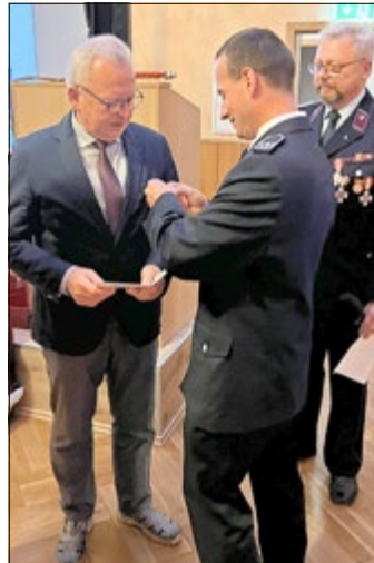
Der Bürgermeister erhält die Ehrennadel in Gold