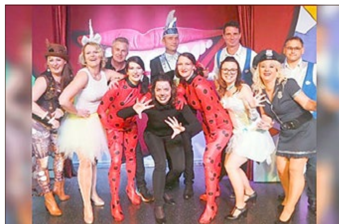
Der alte Vorstand des SCU