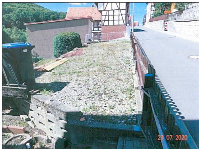
Nachbargrundstück das für Stellplätze gepachtet werden kann, im Vordergrund Zuwegung (Treppen) zum Schuppen und überdachter Sitzfläche