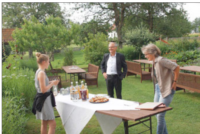
Die Vorbereitungen sind in vollem Gange