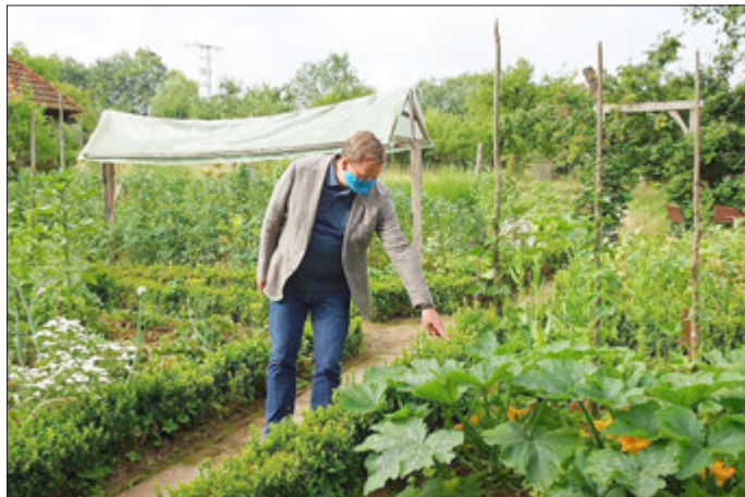
Ein sachkundiger Kenner alter und neuer Kulturpflanzen

Pünktlich um 09:15 Uhr kam das Fahrzeug mit dem Ministerpräsidenten auf dem Hof Sickenberg an. Nach der Begrüßung führte Kristina Bauer ihre Gäste über die Hofanlage mit den historischen Gebäuden und dem liebevoll angelegten Bauergarten. Besichtigt wurde unter anderem das Backhaus mit dem alten Lehmbackofen, in dem heute wieder echte Sauerteigbrote und saftige Hefekuchen gebacken werden. Auch der direkt an der Hofterrasse gelegene Bauerngarten fand Interesse bei den Besuchern. Bodo Ramelow erwies sich dabei als sachkundiger und interessierter Pflanzenkenner.