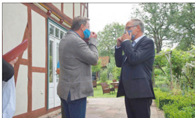
Die Maske sitzt