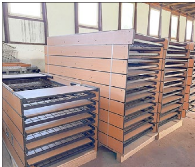
Foto: A. Nolte, Ordnungsamtsleiter der VG Uder Redaktion der VG Uder