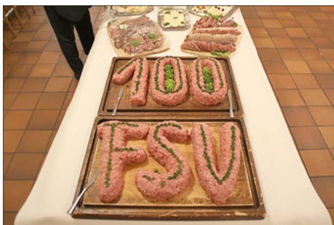
Buffet der Festveranstaltung