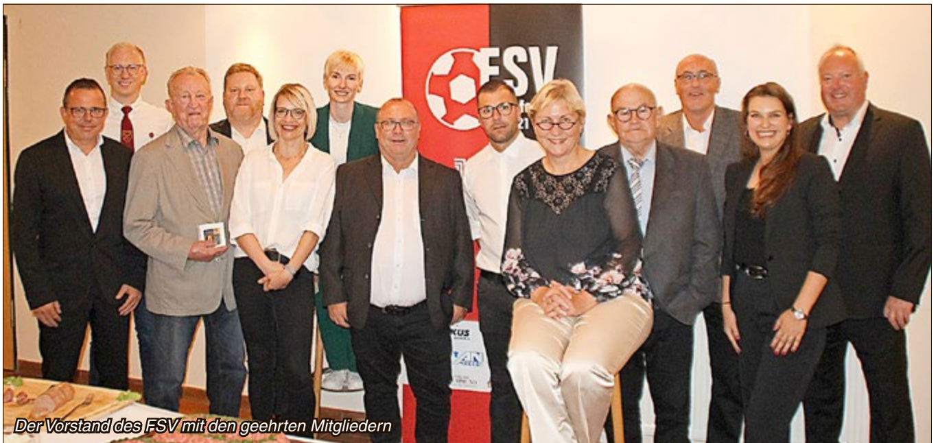
Der Vorstand des FSV mit den geehrten Mitgliedern