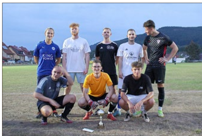
Sieger des Bürgermeisterpokals: „Macca Rooney“