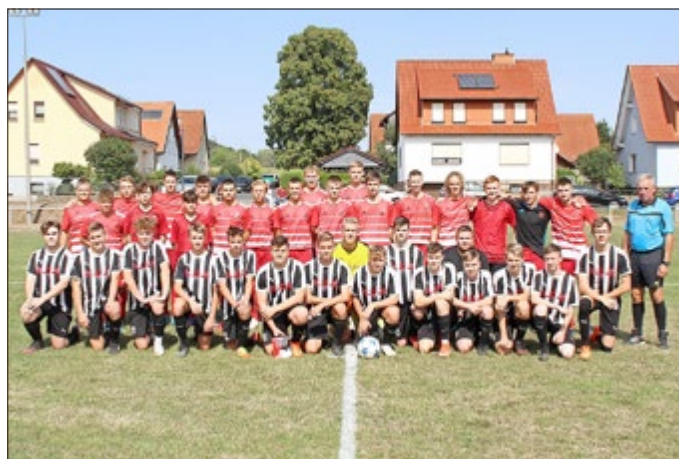
Die A-Junioren und die Mannschaft aus Kammerbach