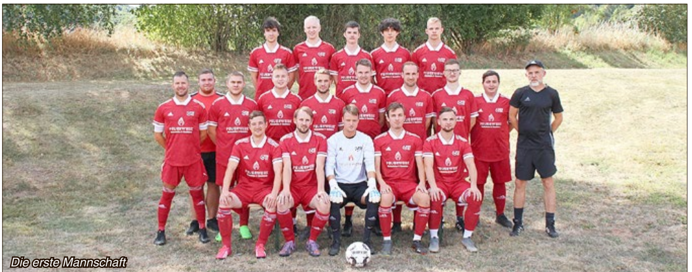
Die erste Mannschaft