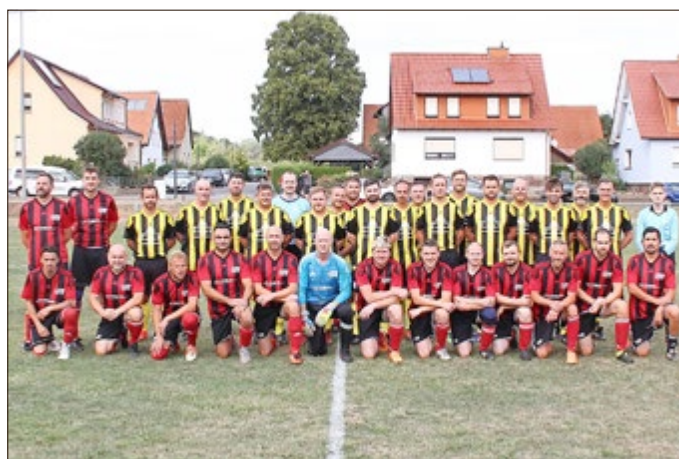
Die Alte Herren Mannschaft Birkenfelde und eine Auswahl der Alten Herren Gerbershausen/Arenshausen