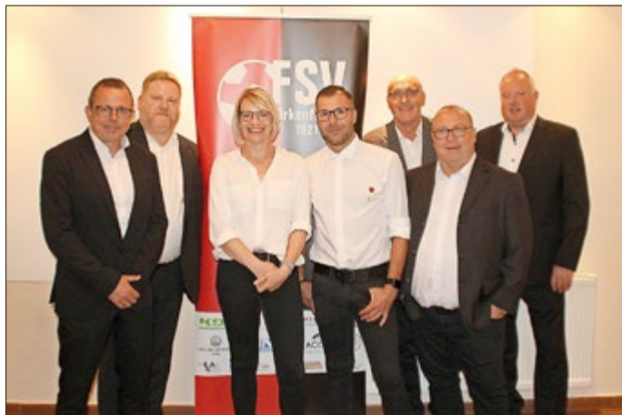
Der Vorstand des FSV