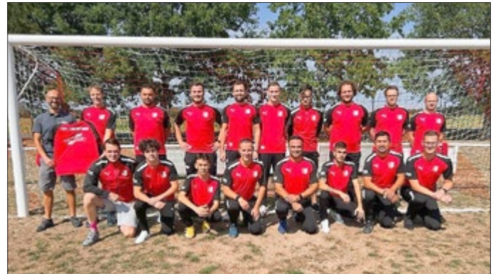
Der FSV Thalwenden