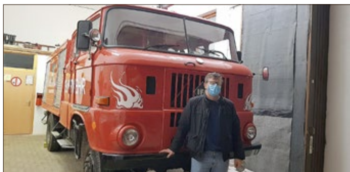
Der alte W 50 der Feuerwehr Steinheuterode wird außer Dienst gestellt