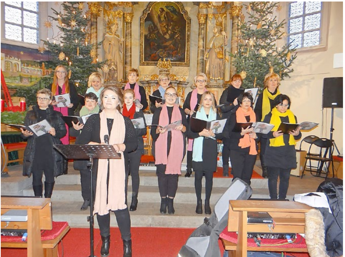
Weihnachtskonzert des Chors a'colori aus dem Vorjahr